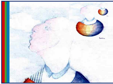
Tavola modificata di Roill096 (Bari)