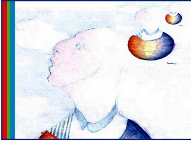
Tavola modificata di Roill096 (Bari)